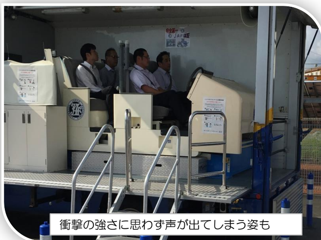
衝撃の強さに思わず声が出てしまう姿も

今週末より『秋の全国交通安全運動』も始まりますので 期間中の取組みとして、9月27日には 弊社、全拠点一斉での立哨活動を行う計画となっております。引き続き 社内外への交通安全の啓蒙を実施して参ります！