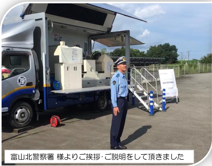
富山北警察署 様よりご挨拶・ご説明をして頂きました

富山北警察署様、JAF富山支部様 ご協力のもと、シートベルトコンビエンサーを搭載した特殊車両にて 時速約 5kmでの衝突の体験をしました。