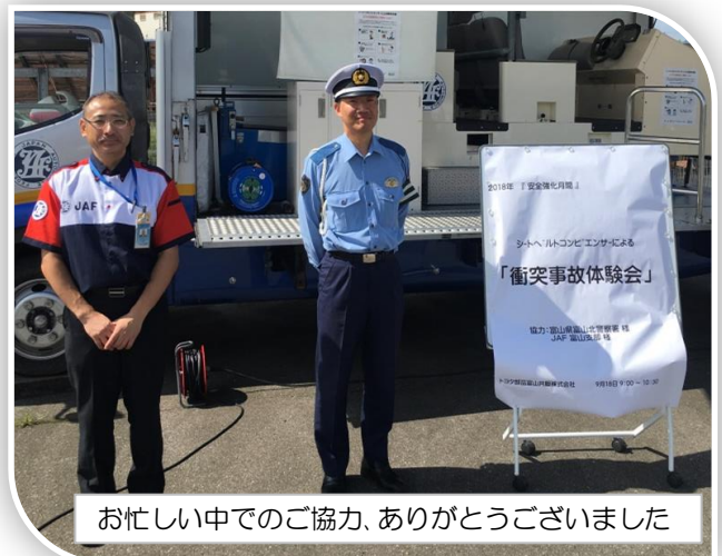
お忙しい中でのご協力、ありがとうございました